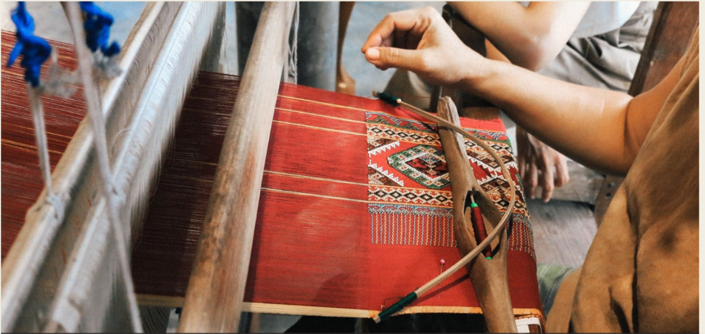
Taiyuan : The Queen Thai cloth of Saraburi.